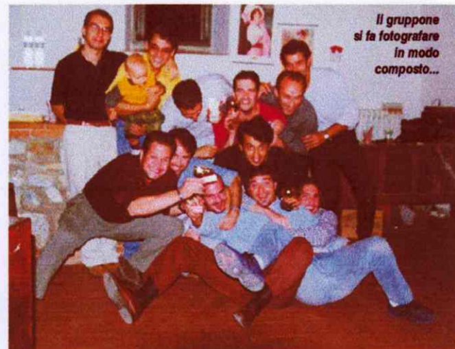
Il gruppone si fa fotografare in modo composto...