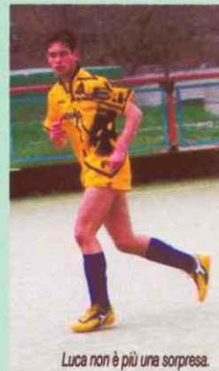
Luca non è più una sorpresa.

Per Luca dopo una partenza sprint, c'è stato un leggero afflosciamento invernale, ma a primavera è esploso palesando anche miglioramenti tecnici che lo hanno messo in condizioni di lottare per il titolo contro ogni pronostico. Logico che i voti lo favorissero permettendogli raggiungere un bis che solo Lorenzo Pieragnoli e Sergio Tamborrino sono riusciti a conseguire.