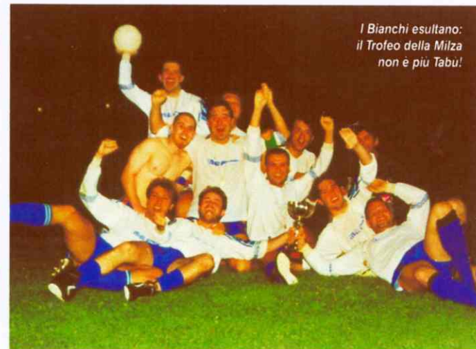
I Bianchi esultano: il Trofeo della Milza non è più Tabù!