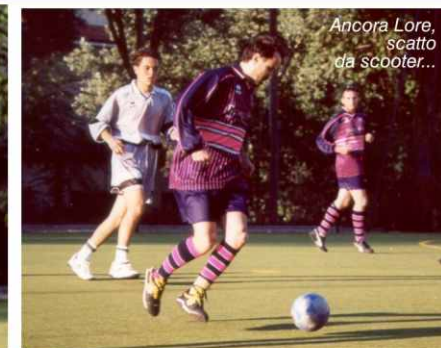
Ancora Lore, scatto da Scooter...