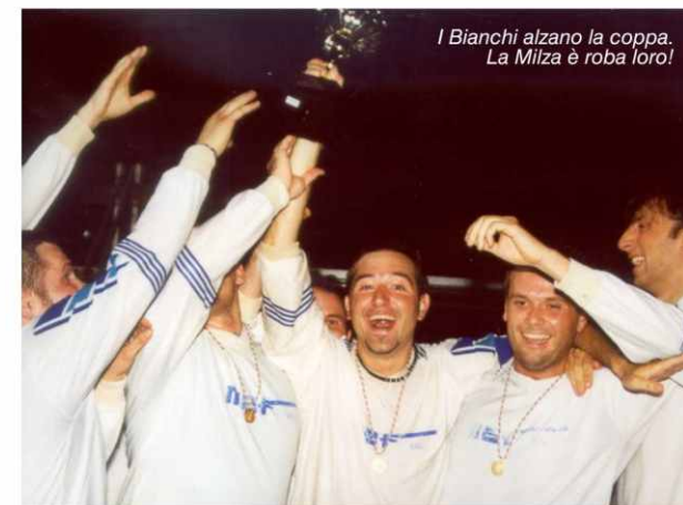
I Bianchi alzano la coppa. La Milza è roba loro!

primo tempo da dimenticare, ripresa positiva; spreca la palla del pari.