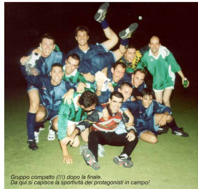
Gruppo compatto (!!!) dopo la finale. Da qui si capisce la sportività dei protagonisti in campo!