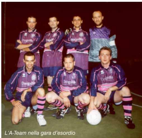
L'A-Team nella gara d'esordio

È stata una meravigliosa avventura. Complicata da portare avanti (il calendario fittissimo e l'A-League nel mezzo, con la Partita della Milza in più!), ma alla fine il risultato è stato fantastico. Abbiamo intrapreso questo cammino con curiosità, per vedere quanto il nostro valore era comparabile a quelle delle squadre che solitamente partecipano ai tornei amatoriali ufficiali. Beh! Abbiamo sfiorato la finalissima per un pelo, abbiamo dimostrato che l'A-Team non è solo un gruppetto di amici che tirano due calci a pallone, abbiamo dimostrato che sappiamo stare in campo, che sappiamo soffrire, che sappiamo imprimere il nostro ritmo, che sappiamo perdere e imparare anche dalle sconfitte.